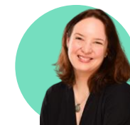
Friederike Kaemena Kaemena & Koepke GmbH